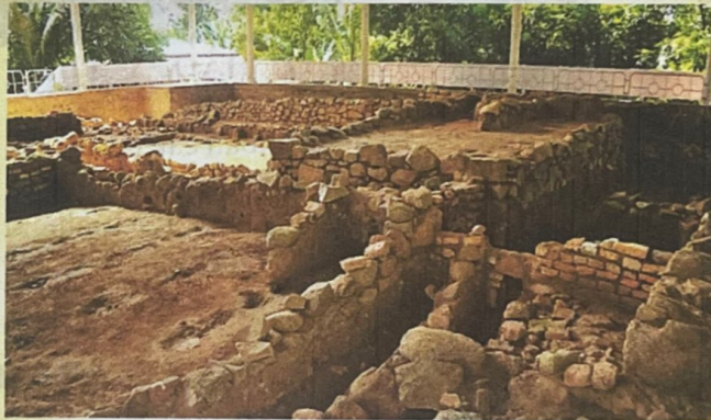
Di tích Linh Sơn Nam