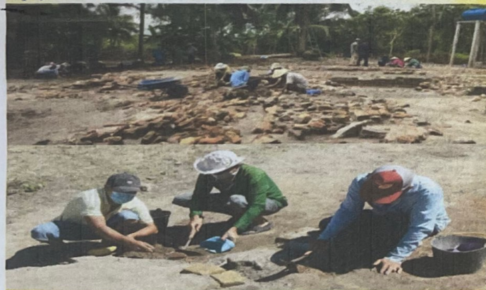
Nhân dân thực hiện công tác bảo quản di tích

Từ những giá trị lịch sử, văn hóa và khoa học đặc biệt ấy, Khu Di tích Khảo cổ Óc Eo - Ba Thê không chỉ là niềm tự hào của địa phương mà còn là di sản chung của cộng đồng. Việc bảo tồn và phát huy giá trị di sản không chỉ là trách nhiệm của các cơ quan quản lý nhà nước mà còn đòi hỏi sự tham gia trực tiếp, tự giác và thường xuyên của mỗi người dân, thông qua những hành động cụ thể nhằm gìn giữ, bảo vệ và truyền lại các giá trị quý báu của di sản cho các thế hệ mai sau.